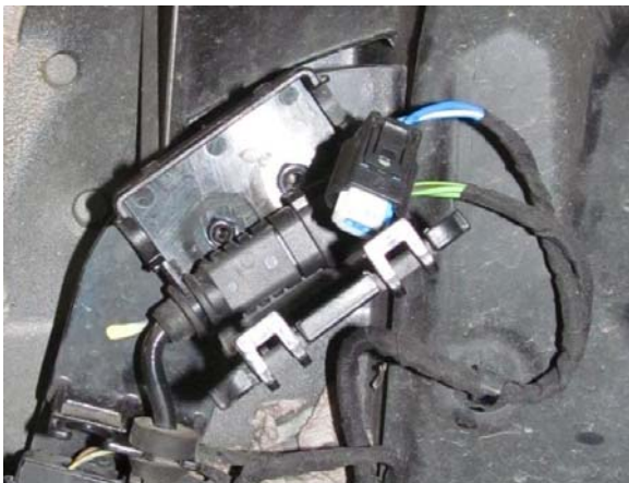
Steckersicherung Connector lock